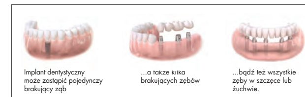
Implant dentystyczny może zastąpić pojedynczy brakujący ząb

Implanty wykluczają konieczność użycia klejów mocujących zapewniających utrzymanie protezy na miejscu, a także eliminują podrażnienia i ból często związany ze źle dopasowanymi protezami. Implanty stymulują kość szczęki ograniczając zanik kości i przyczyniają się do zachowania naturalnego kształtu twarzy.